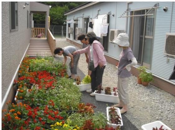
気仙沼仮設住宅を 花で飾ろうプロジェクト