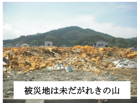
被災地は未だがれきの山