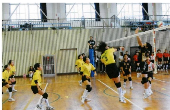
宮城県東部小連・秋田市小連親睦交流会