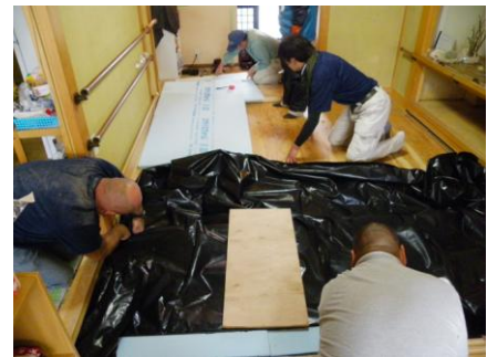
被災地支援ボランティア