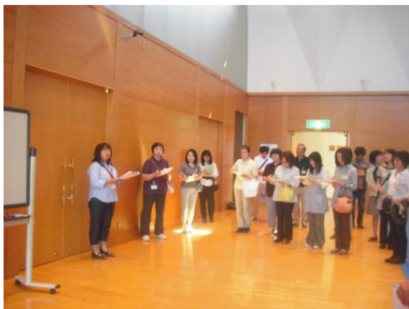
秋田県内在住被災者家族交流会