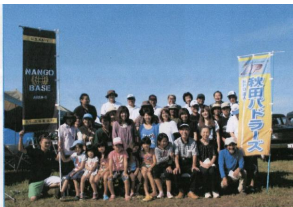
親子で楽しむ自然体験